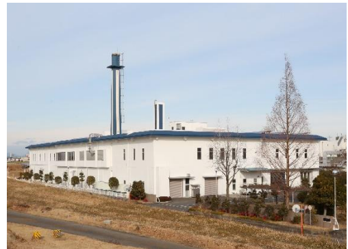
現衛生プラント（御幸町）