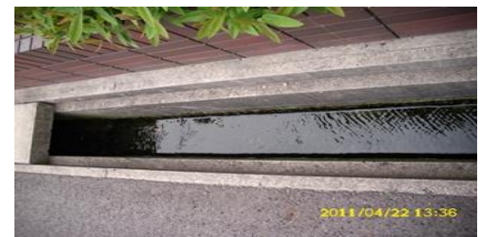
未処理の生活排水が直接放流される側溝