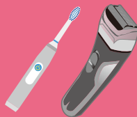
電動歯ブラシ・電気シェーバー