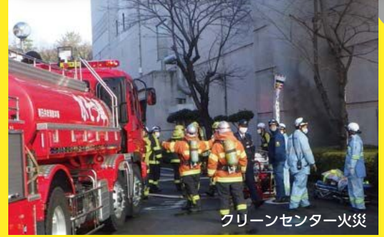
クリーンセンター火災