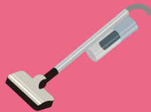
コードレス家電 (充電式掃除機など)