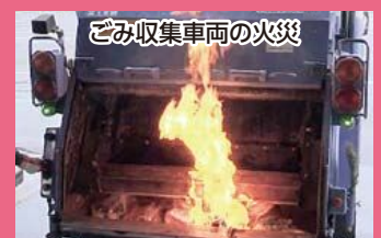
ごみ収集車両の火災