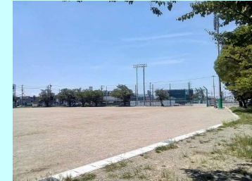
中央公園グラウンド