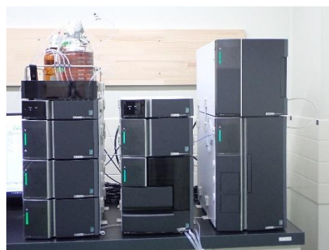
イオンクロマトグラフ